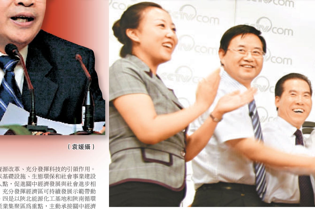
「關中—天水經濟區」有關領導一起為經濟區的未來攜手鼓勁，從左至右依次為：陝西省發改委主任祝作利、甘肅省天水市委常委、常務副市長柴金祥、西安市常務副市長董軍、寶雞市長戴征社、咸陽市長莊長興、渭南市市長徐新榮、商洛市長楊冠軍、楊凌示範區管委會常務副主任梁宏賢