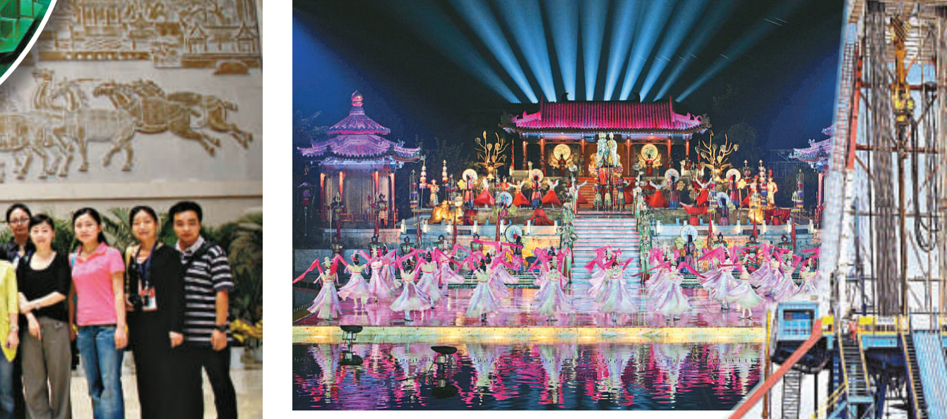
►華清池大型實景舞臺劇《長恨歌》是陝西人文旅遊產業一張亮麗的名片