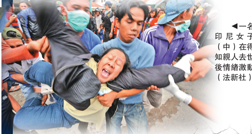
◀一名印尼女子(中)在得知親人去世後情緒激動