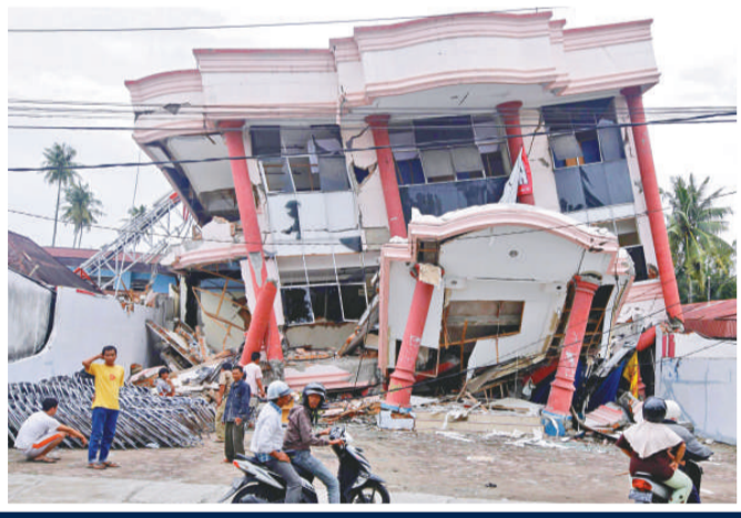
▲居民望着在地震中倒塌的住宅