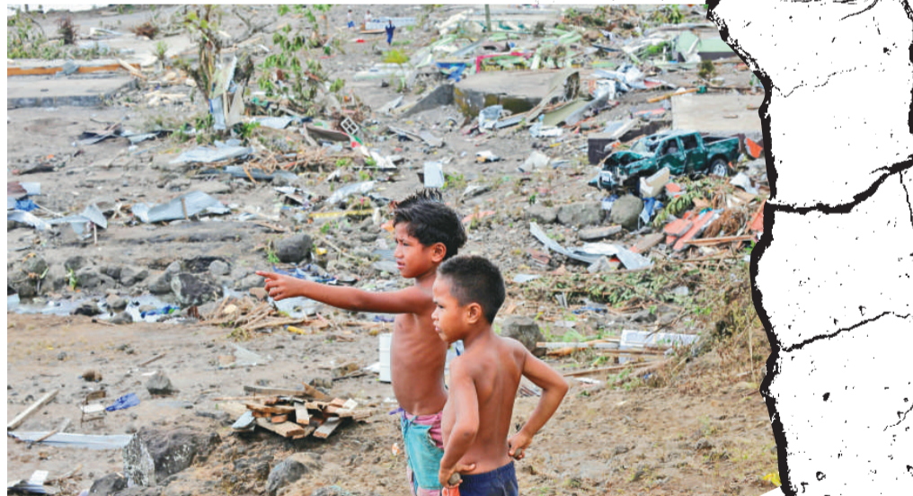
兩個男孩站在薩摩亞被海嘯摧毀的村莊 (法新社)

天災。譬如，死於熱帶風暴「凱薩娜」的菲律賓人，許多都是住在人口過密、排水系統差勁的河畔貧民區；地質學家很早已警告印尼的巴東市極可能發生大地震，偏偏還是有近百萬名市民住在質量欠佳的建築中。一位在新加坡工作的地質經濟學家指出，天災死傷慘重往往與政商界不擇手段發展經濟以及貪污有關。 (法新社)