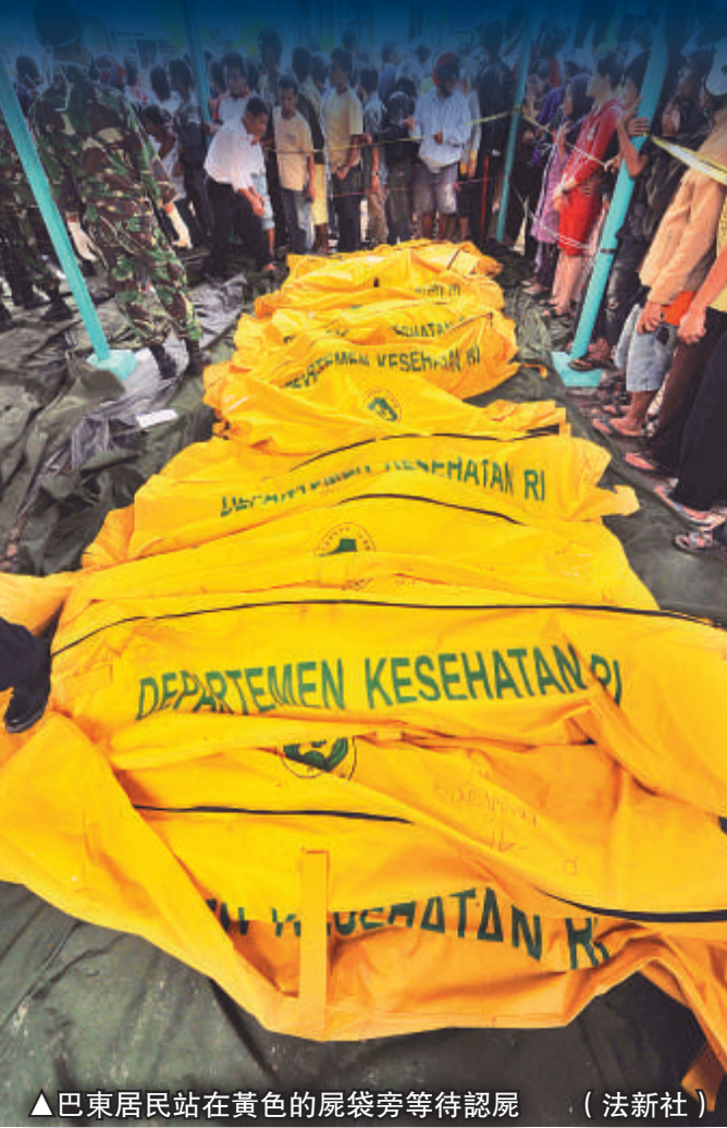
▲巴東居民站在黃色的屍袋旁等待屍