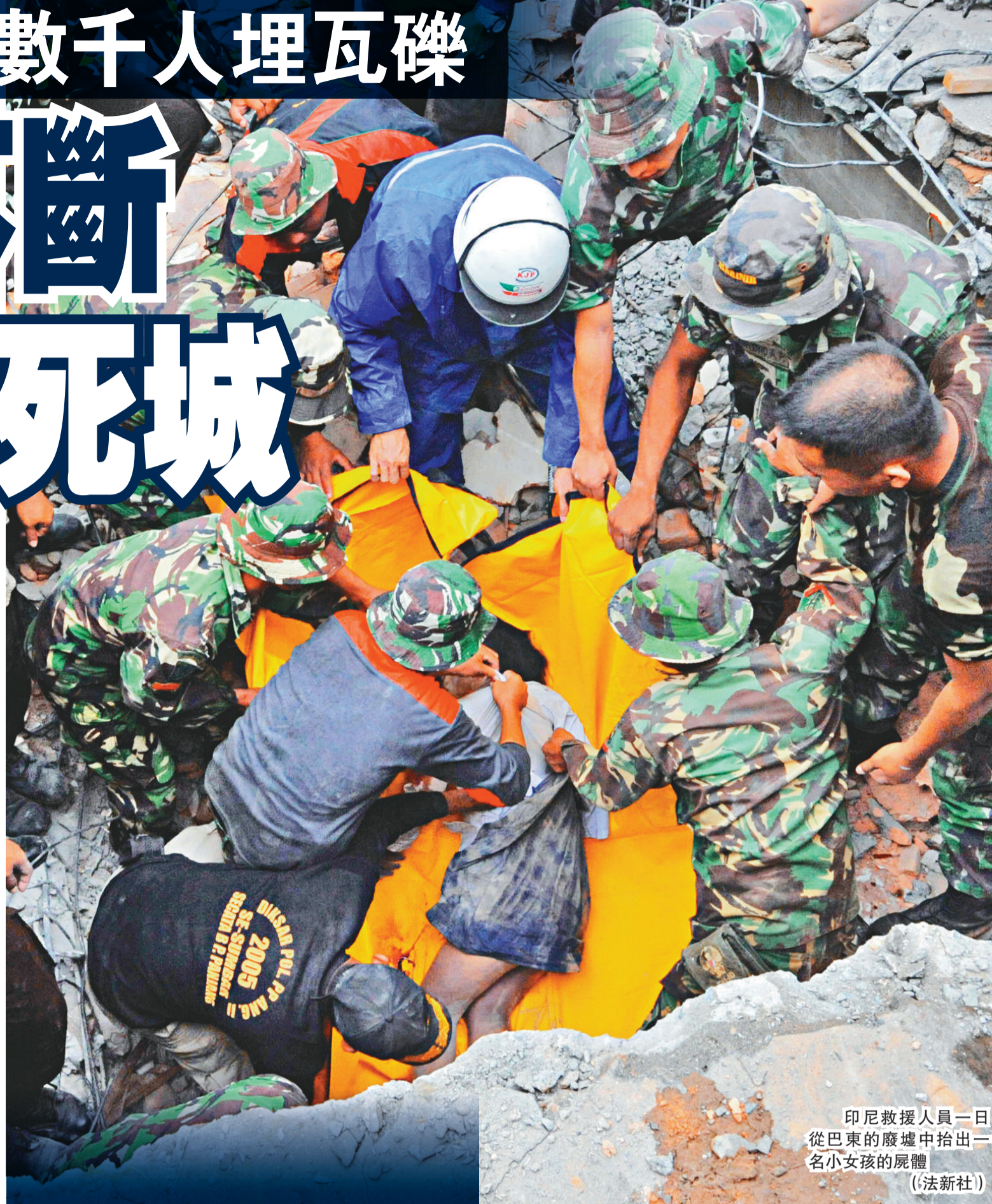
印尼救災人員一日從巴東的廢墟中抬出一名小女孩的屍體

三十日較早前，薩摩亞群島發生八級大地震，引發海嘯，導致至少一百多人死亡。兩場大地震的震央均位於地殼不穩定的環太平洋「火環」地震帶內。