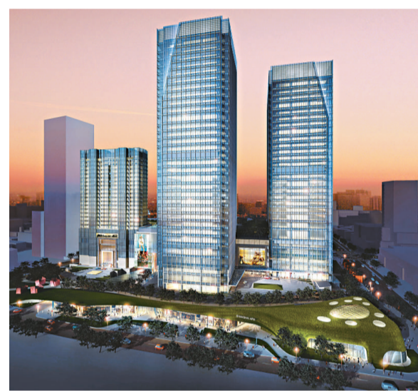
▲位於上海淮海的豪華住宅項目將開創世界級豪宅新典範。▲上海環貿廣場位於浦西最繁盛商業區，由特色商場、優質寫字樓及豪華住宅組成。

位於浦西繁盛地段淮海路中的上海環貿廣場，項目包括高級商場、寫字樓及豪華住宅，商場部分將連接新建的地鐵站，為三條地鐵幹線的交匯點，是區內交通的重要樞紐。物業採用世界級設計及環保建築，曾獲頒國際Cityscape最佳商業及零售項目殊榮，以及美國綠色建築委員會頒發節能與環保設計（LEED）前期認證金級證書，為上海的建築物確立新標準。