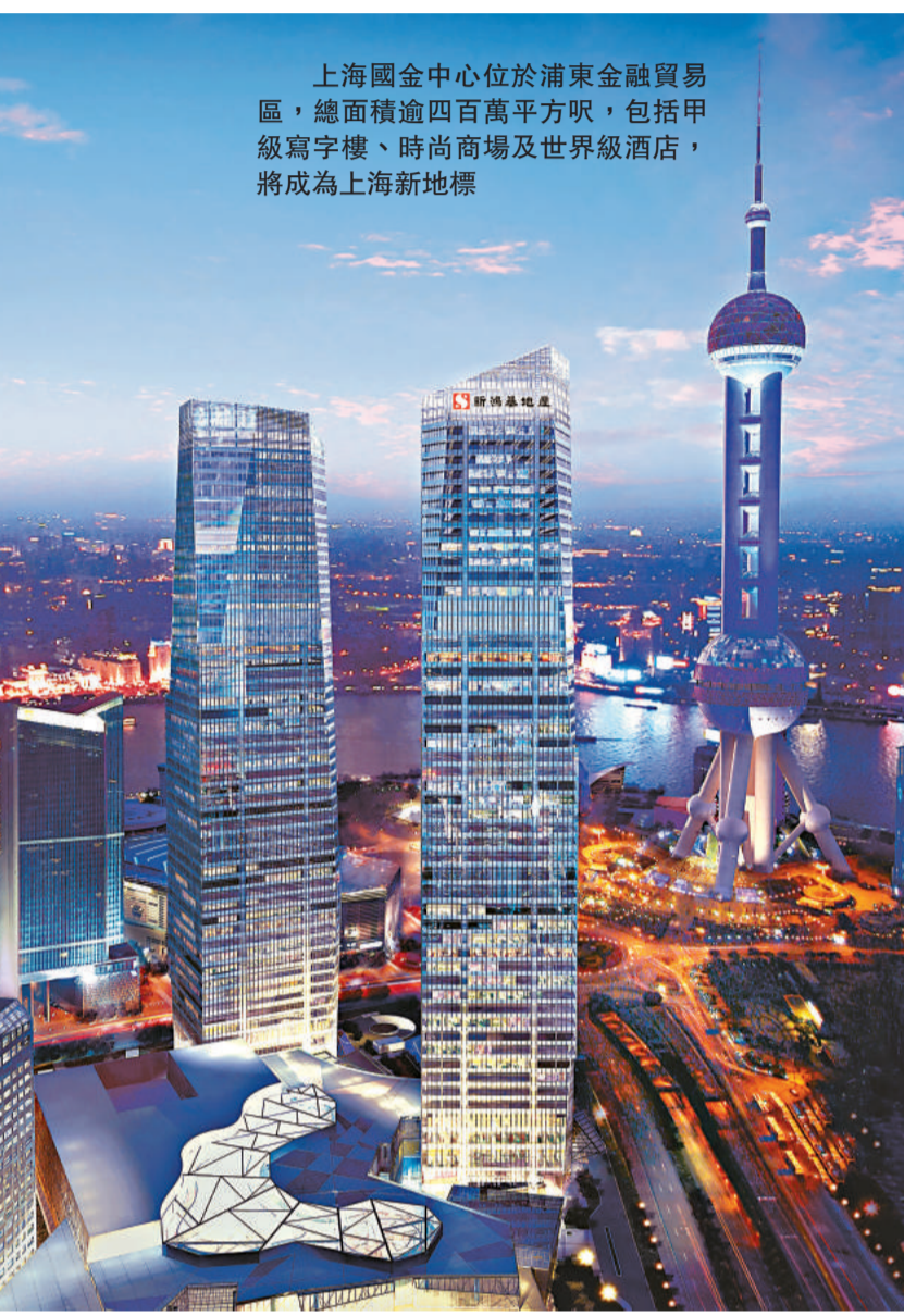
上海國金中心位於浦東金融貿易區，總面積逾四百萬平方呎，包括甲級寫字樓、時尚商場及世界級酒店，將成為上海新地標