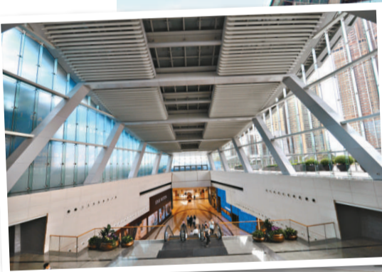
環球貿易廣場採用世界級建築設計，引入先進科技設施全面迎合跨國企業的要求