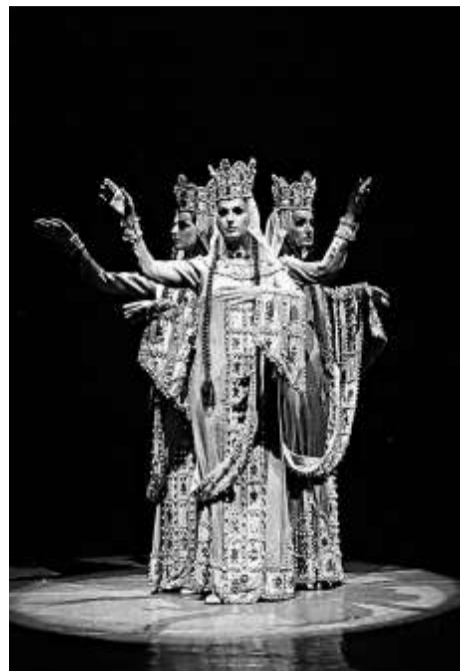
格魯吉亞國家舞蹈團女舞者飄逸嫵媚。

【本報訊】格魯吉亞國家舞蹈團將於十月底來港，為大家獻演民族風味濃郁的舞蹈。由於反應熱烈，十月三十、三十一兩場已經滿座，加開十月二十九日一場，在沙田大會堂上演。《紐約時報》有評論文章稱譽該團為「發放典雅光芒的民族瑰寶」。