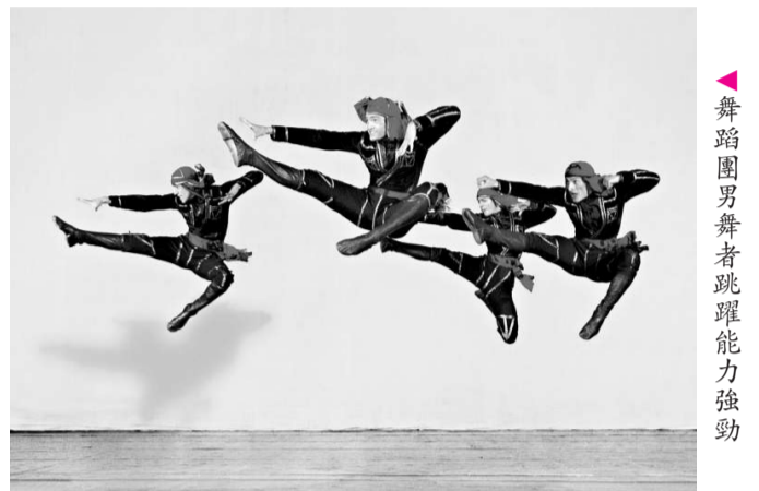
舞蹈團男舞者跳躍能力強勁。