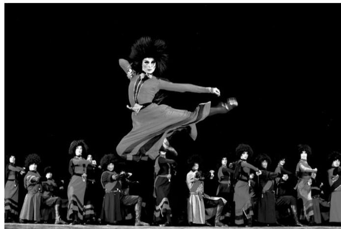
格魯吉亞國家舞蹈團十月底在沙田、荃灣演出。

「絲綢之路藝術節」節目詳情，可參閱現於各城市電腦售票處派發的節目指南；或瀏覽網址： www.silkroadfestival.gov.hk 。節目查詢可致電二三七〇一〇四四。