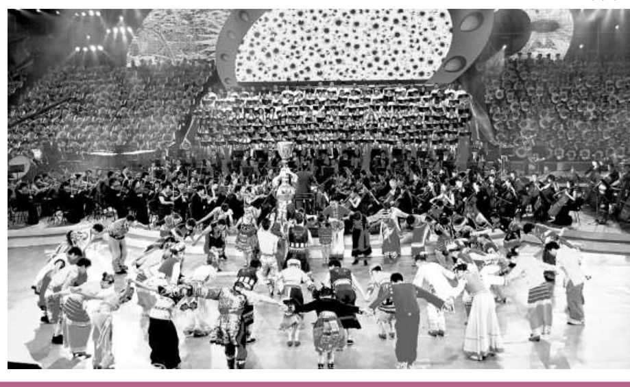
二十六個民族共同祝祖國繁榮昌盛。