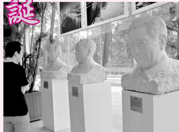
「共和國之魂」精品畫出。

【本報記者秀賢廣州一日電】今天是新中國成立六十周年舉國歡騰的日子，著名雕塑家曹崇恩個人雕塑精品展「共和國之魂」今天上午在頤和高爾夫山莊藝術館開幕，展出了共和國領袖、民主人士、英雄人物等三十多個雕像，從不同側面展現在民族解放和祖國建設過程中在各領域做出突出貢獻的人物風采，獻禮華誕。