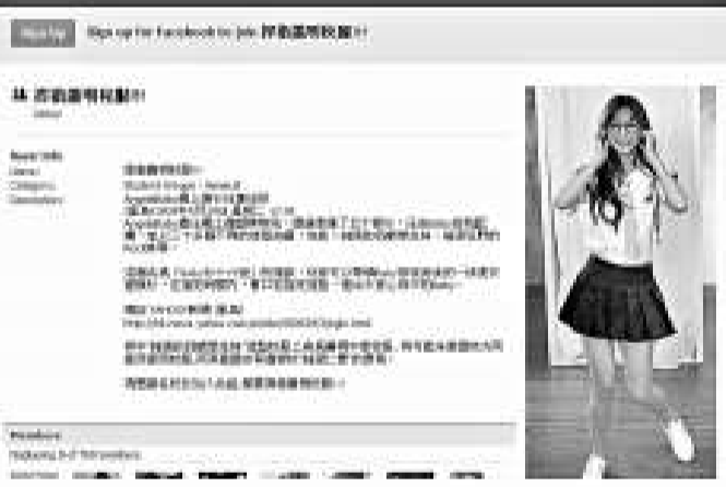
日前有「嘍模」穿着某女校校服擔任網上遊戲模特兒，引起學生不滿，而群起抗議

【本報訊】今年暑假舉行的書展「嘍模」寫真集賣個滿堂紅，但爭議不斷，當中 AngelaBaby（楊穎）近日穿上某女校校服擔任網上遊戲模特兒，引起學生不滿，並在社交網站 Facebook 建立群組以捍衛校服，截至昨日已有逾一千人加入。