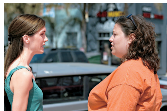
◀ 研究顯示，女性中年發胖，她們晚年享受健康生活的幾率將大為降低。

研究人員指出，體重屬於可以更改的因素，因此健康地變老不僅僅由基因或其他不可改變的因素決定；如果女性在成年後維持健康體重，她們晚年享受健康生活的幾率就可以大大增加。(新華社)