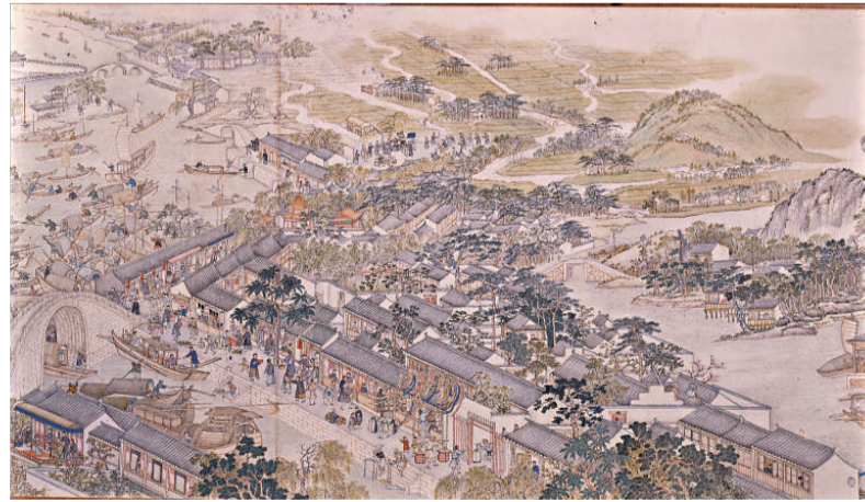
▲蘇州城外的店舖，有售賣上朝穿着的「朝靴」