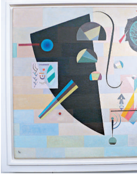
▲康定斯基的《戲劇性與溫柔感》

【本報訊】記者鍾麗明報導：香港蘇富比秋季拍賣會今日開鑼，在香港會議展覽中心的預展場內，陳列着各拍賣部分的拍品。在琳琅滿目的藝術品中，包括一批將於紐約蘇富比拍賣的歐洲印象派及現當代藝術作品。其中畢加索一幅繪畫騎士的畫像作品，估價高達八百萬至一千二百萬美元（折約港幣逾六千萬至九千萬港元），另一幅野獸派畫家梵東榮的作品，亦估價七百萬至一千萬美元（折約港幣逾五千萬至七千萬港元）。