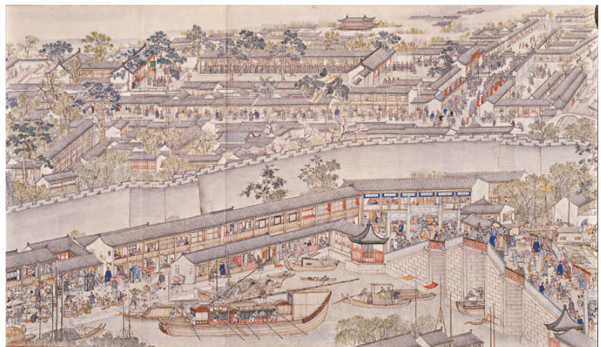
▲徐揚繪畫了蘇州城牆內考試的場面（畫卷上方）