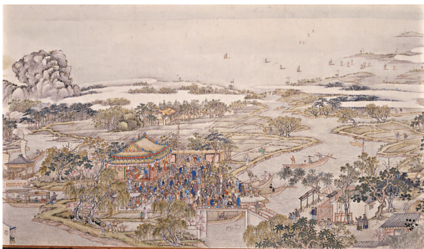
▲清代演出社戲時，男女分席而坐