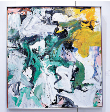
▲德庫寧的畫作《無題15號》是一幅抽象風景畫