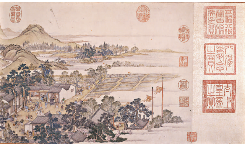
《姑蘇繁華圖》的開卷描繪春日早上農民下田的情景

中國畫，向以文人畫主導，風俗題材的畫作不多，像《清明上河圖》及《姑蘇繁華圖》，被稱為「界畫」的畫作，地位不如文人畫。但在今天來看，卻是匠心獨運的經典巨製，國之重寶。