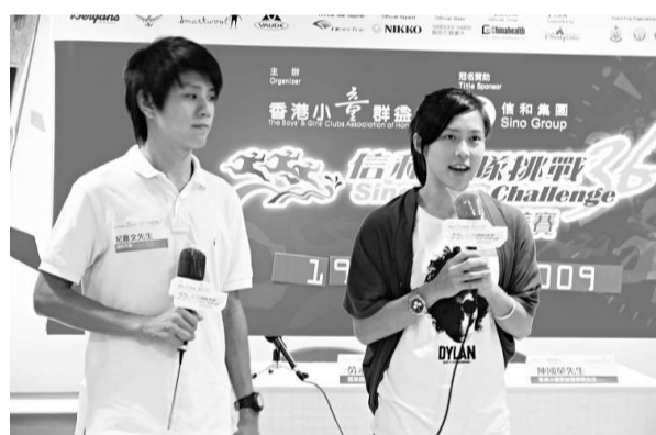
▲小童群益會調查，四成中學生過去一周情願打機上網不做運動

此外，調查中，近九成七校長認為教育局須設立中央轉介機制，將吸毒學生轉往外輔機構，有助於戒毒學生重返校園，亦應設專責隊伍，支援學校處理初次吸毒的學生。另有近九成校長認為若政府增撥資源，學校應推行一校兩社工作制度。