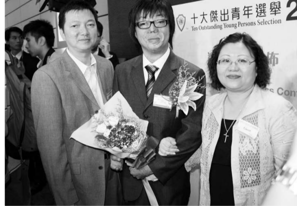
▲國際青年商會香港總會昨日公布「十大傑出青年2009」結果，今年共有八位傑青獲選（前排八位）