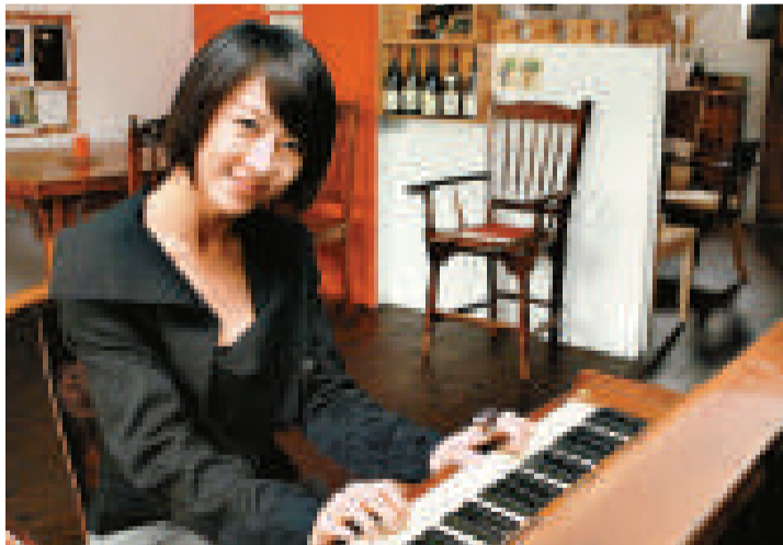
▲河智苑表示拍完新片後，無法抽身而情緒低落 ▼河智苑（右）和金明敏主演的新片《我的愛在身邊》