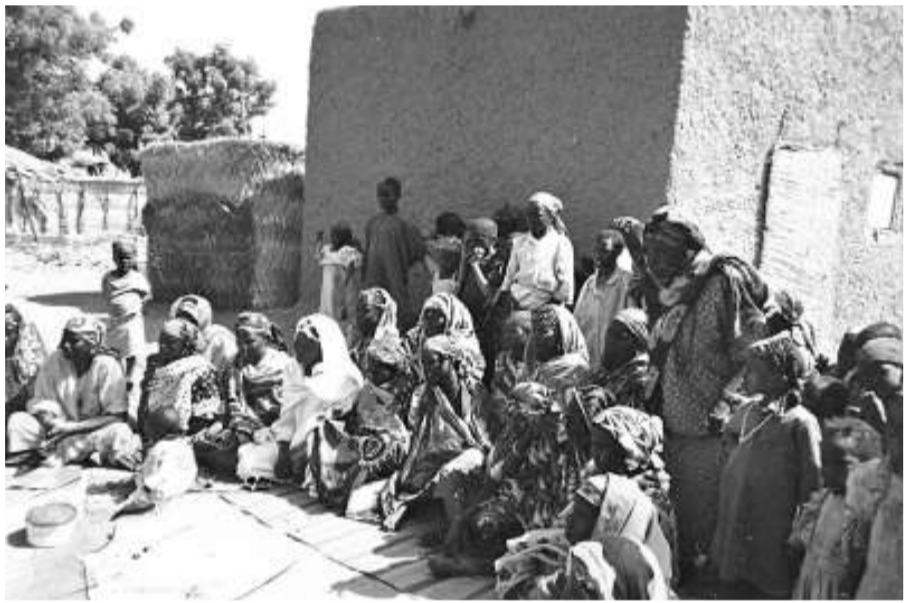
全球最差的居住地是非洲的尼日爾