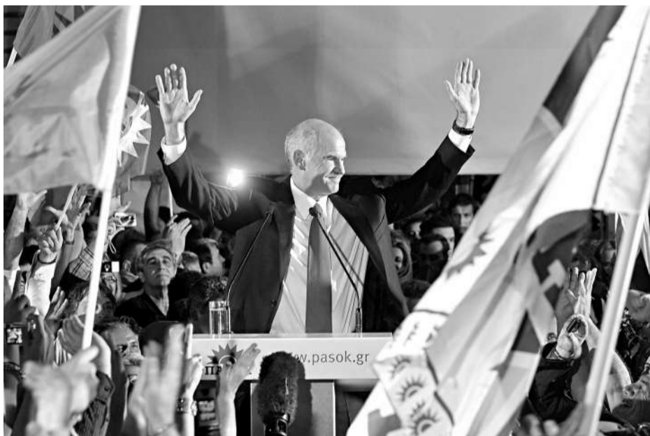
帕潘德里歐在大選中勝出後發表講話，並接受支持者祝賀