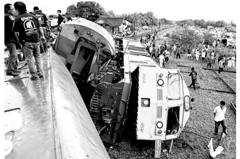
救援人員在火車脫軌現場施救

泰國老化的鐵路網在雨季的時候不時會發生小事故，尤其是在道口。就在這起事故發生前不足二十四小時，一列運載水泥粉的火車在曼谷以北出軌，當局沒接到傷亡報告。