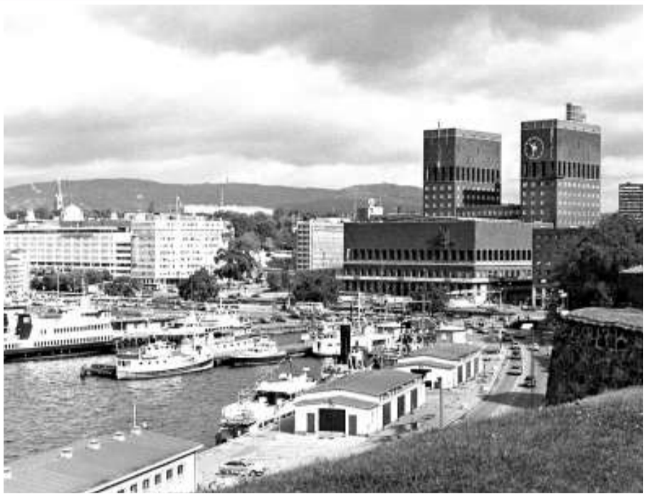
挪威蟬聯全球最適合居住的國家

聯合國開發計劃署表示，1980年至今，全球的人類發展進步了一成半，在這段時期中進步最大的國家是中國、伊朗和尼泊爾。人類發展指數乃於1990年起每年公布。