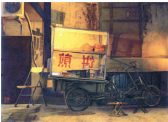
▲《那時》畫出老北京在早上賣煎餅的溫馨回憶