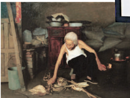
▲陳永亮這兩幅畫展現同一地點早晚時光的光景