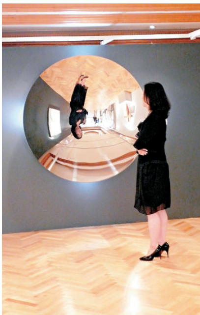
▲安尼什·卡普爾的作品首度亮相亞洲拍賣會

月在港舉行拍賣會，並創下理想成績。今年七月該公司在中環歷山大廈的新辦事處正式啟用，即將舉行的「現代及當代藝術」秋季拍賣會，先後在上海、首爾、台北及香港舉行預展。