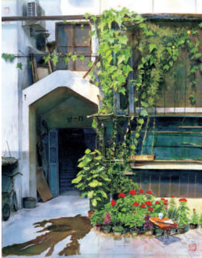
▲作品《廿一號》，雖是畫舊房子，卻以鮮綠的藤蔓及地下的水跡，展現現在式的生活氣息