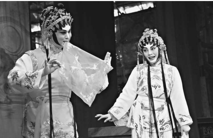
神功戲《花田八喜》中一幕男扮女裝的喜劇