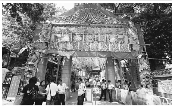
▲不少善信在每年的黃大仙寶誕都會往祠內參拜

推介活動：農曆八月廿三（西曆十月十一日）是黃大仙寶誕。除了黃大仙祠外，龍翔道的黃大仙元清閣也有寶誕活動。