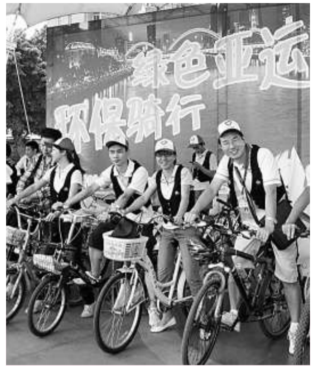
廣州志願者騎行宣傳綠色亞運訊息

廣東省常務副省長黃龍雲在陽江索性向地方官授計，如何實現藏富於民。他建議：地方政府應重視農業、海洋漁業、旅遊業和林業等建設，因為這些行業經濟的發展，雖然不會明顯增加政府財政收入，卻是厚養民生的富民產業，有利於實現社會和諧。政府的財政腰包應寄望於能源、航運、臨港大工業大企業的發展。