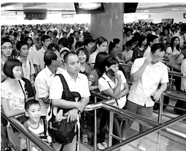
國慶長假結束，廣東各大口岸迎來回程人潮，而治安未見惡化

另外，國慶期間全省共發生各類交通事故633宗，死亡155人，受傷791人，同比分別下降39%、21%、39%。其中一次死亡3人以上的特大交通事故1起、死亡3人，同比分別下降67%、75%。全省消防安全形勢平穩，共發生火災100起，死亡1人，傷2人，直接財產損失70.2萬多元，未發生重大火災事故。