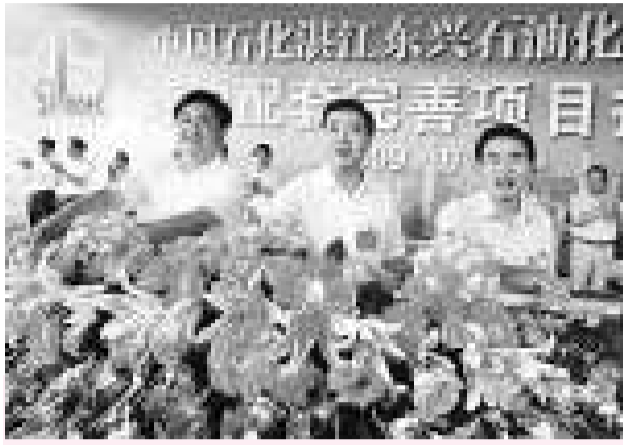
汪洋與黃華華日前率領五十多名廳級以上高官，考察雲浮、陽江、茂名和湛江四市，部署廣東未來經濟發展 (資料圖片)

【本報訊】經過金融風暴洗禮後的廣東高層，對民資民企的態度，已經從重視上升到了青睞。日前，汪洋在陽江公開表示，粵西不少地方民資民力相當發達，是今後經濟發展的優勢籌碼。他要求地方官引導民營企業做大做強。