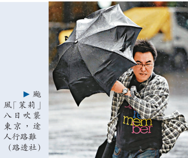
▲颱風「茉莉」八日吹襲東京，途人行路難

【本報訊】綜合法新社及美聯社八日消息：颱風「茉莉」八日吹襲日本本州，造成兩死約百傷，數十萬戶民居停電，並引發山泥傾瀉恐慌。