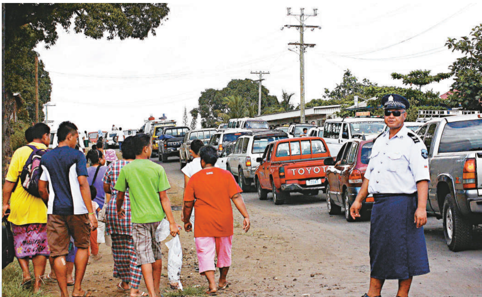
▲薩摩亞首都阿皮亞八日收到海嘯警報後，居民向高地撤離，引發交通堵塞

由八十三個島組成的瓦努阿圖沒有即時的傷亡及損毀報告。那兒位處澳洲悉尼東北方二千二百公里。