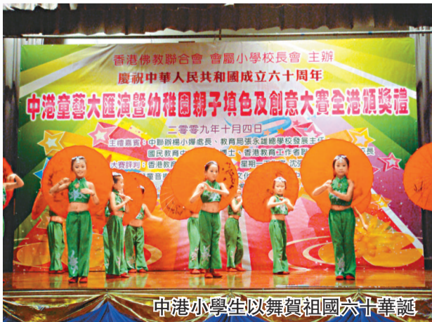
中港小學生以舞賀祖國六十華誕

剪綵儀式後，表演開始。來自浙江樂清市白象蕾絲舞蹈藝術中心、四川成都市武侯區青少年宮、山東青島市小太陽舞蹈藝術團、湖南長沙市小丫培訓中心、雲南宣威市少兒舞蹈培訓學校及廣東茂名市新廟藝術培訓中心的數十名小演員，與佛教中華康山學校、佛教黃埔菴小學、佛教慈敬學校、佛教林炳炎紀念學校、佛教林金