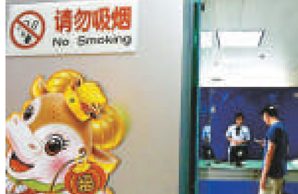
▲上海市武寧路上一家電器商場內的禁煙標識十分醒目

據悉，錫礦山閃星錫業有限責任公司礦區面積22.5平方公里，前身為錫礦山礦務局。錫礦山錫礦於1897年正式開採，有「世界錫都之稱」，目前已形成4萬噸錫品、4萬噸精錫、10萬噸化工產品的生產能力，是中國錫品深加工的主要科研基地和生產基地，也是全球最大的錫品生產商和供應商。