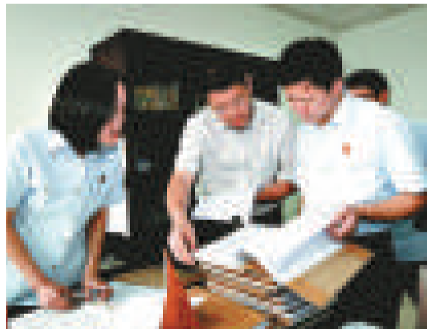
▲法官正在研究即將開庭審理的涉黑涉惡案件（網上圖片）

【本報訊】中通社重慶九日消息：12日起，重慶「涉黑」案件將陸續開庭審理。據悉，此次「打黑除惡」系列案件審判，個案被告最多60餘人，預計個案庭審時間最長將達15至16天，將創重慶法院審判歷史多項之最。同時，各法院加強庭審安全保衛工作，對所有參與押解的法警統一指揮、食宿，確保庭審順利。