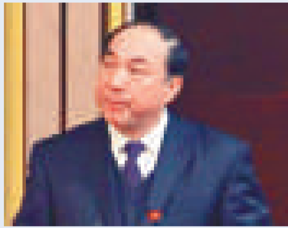
▲武漢大學原常務副校長陳昭方（網上圖片）