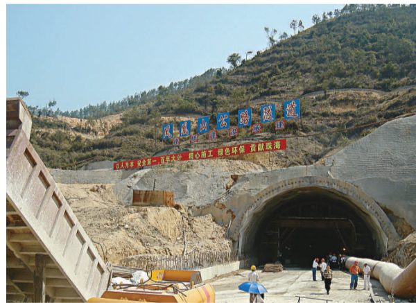
▲國慶黃金周過後，廣東省內主要高速公路將恢復大修工程

廣東省交通廳表示，國慶期間暫停施工的廣佛高速公路擴建工程（雅瑤一謝邊段），從明天始施工全面恢復，直到2010年1月，在約5個月的時間裡將實行「單幅封閉、對向各兩車道行駛」的交通管制措施。而佛開高速公路擴建工程也正進行前期工作，明天起大雁山服務區及大雁山互通立交往開平方向匝道關閉。此外，深汕高速公路西段大修工程在全面停工兩周後，將於10月12日中午起恢復「半幅封閉施工、半幅單向行駛」狀態。