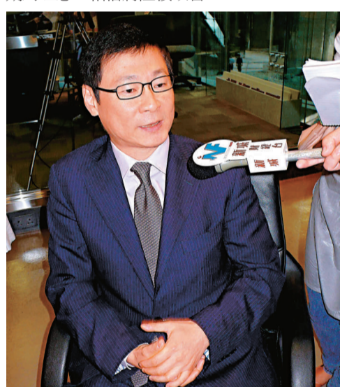
范統有信心富豪海灣成交價再創新高

酒店業務方面，隨著旅客對甲型流感H1N1恐慌淡化，富豪系旗下五家本地酒店入住率亦逐步回升，當中尖沙咀富豪九龍、沙田麗豪及富豪東方入住率達九成，富豪機場則為60%至70%，入住率雖仍較去年遜色，卻較預期表現理想，相信陸續會有改善。