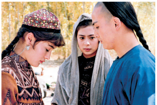
許鞍華執導的《香香公主》

影片包括：何平導演、姜文和趙薇主演的《天地英雄》，許鞍華重現金庸筆下大漠風情的《香香公主》，浪漫神秘的《歷劫鴛鴦》，法國動畫家米修·奧西樂 (Michel Ocelot) 的《一千零二夜》，以及中日合拍的《敦煌》。