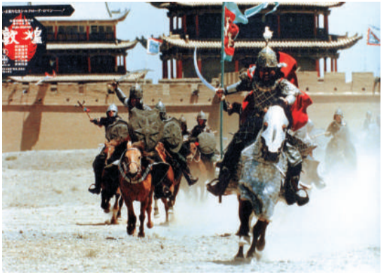
中日合拍的《敦煌》既有戰亂，亦有戀愛情節

為響應即將舉行的「絲綢之路藝術節」，康樂及文化事務署電影節目辦事處籌辦「絲路光影」，選映五部以不同藝術手法拍攝的電影，呈現絲綢之路上中西亞各地的人文特色和藝術風貌，