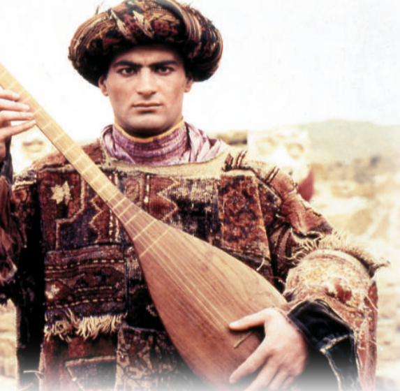
格魯吉亞電影《歷劫鴛鴦》浪漫迷離

畫片《一千零二夜》(2007)。擁有白皮膚藍眼睛的阿蘇與阿拉伯族的阿瑪瑪兩小無猜，長大後雖各闖天下，後來合力戰勝怪獸，解開咒語，進入光明幸福之境。影片既是絲路上的冒險故事，也是不同種族文化打破禁忌、和諧相處的寓言。