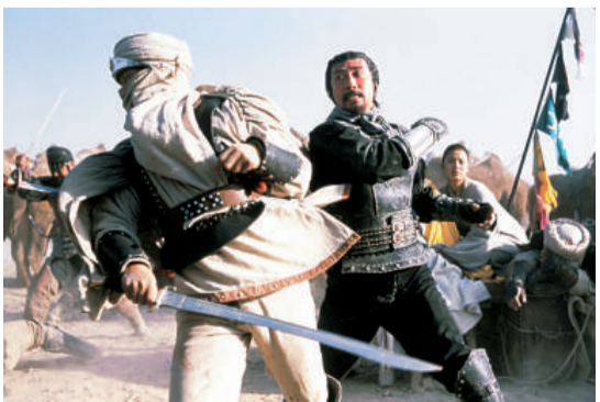
《天地英雄》描寫英雄情義