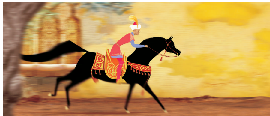
動畫片《一千零二夜》是絲路上的歷險故事