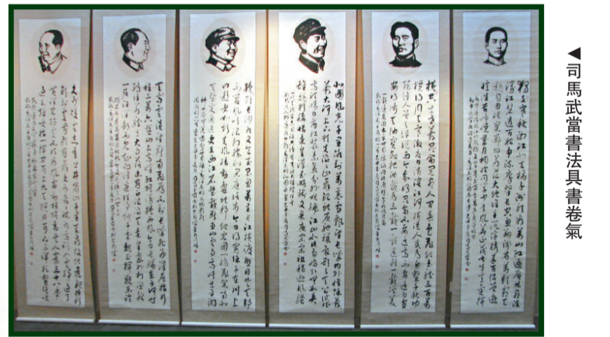
▲司馬武當書法具書卷氣