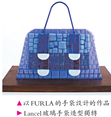
▲以 FURLA 的手袋設計的作品 ▶ Lancel 玻璃手袋造型獨特

是次「玻璃·時裝·藝術展」，即日起至十月二十六日在海港城海洋中心一階舉行。今次的展品將用作慈善拍賣，參觀者可以暗標方式競投，拍賣底價為八千元，所有收益將撥捐「心晴行動」。