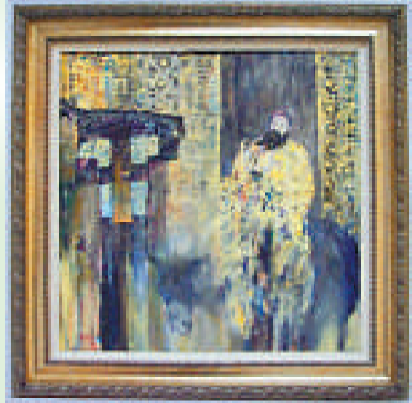
▲戴成熙油畫《回西安》