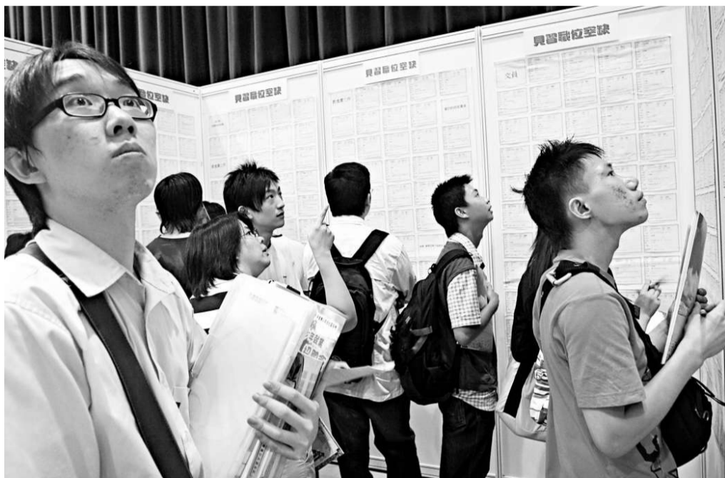
▲自由黨倡最低工資時薪不應高於二十四元（資料圖片）

報告同時建議政府評估香港會展中心及亞洲博覽館的使用率和分工，研究香港展覽業的未來發展，進行適當分工和協調，避免兩個展覽場地出現惡性競爭。