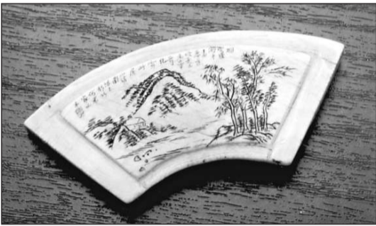
及鼻煙壺等的嗜古者，益覺自己已有的這些藏品珍貴，日常也只止於欣賞與把玩。