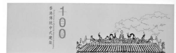
書名：《香港傳統式建築 100 間》 統籌：康樂及文化事務署、古物古蹟辦事處 出版：二〇〇九年

全書以彩色印刷，圖文並茂，介紹歷史建築之餘，還配有不少特色的照片；加上附上該歷史建築的平面圖，令讀者可以清楚了解有關建築的歷史、外觀等。為了讓更多讀者可以了解香港的古建築，書中還附有中英文對照，方便一些對香港歷史建築有興趣但又不懂中文的讀者細讀。