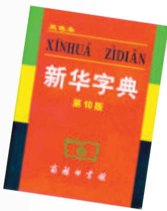
內地最常用字典《新華字典》

語言文字的學習過程中，有一樣東西絕對不可以缺少，那就是字典。顧名思義，字典是為單字提供音韻、字義解釋、例句、用法等等的工具書。另有詞典或辭典之說，則是因為使用字母語言的人群，並沒有字典的概念，例如英文就只有詞典，字典是漢字特有，因此廣泛使用漢字的東方社會才有字典、詞典之分。字典收字為主，亦會收詞；詞典或辭典收詞為主，也會收字。