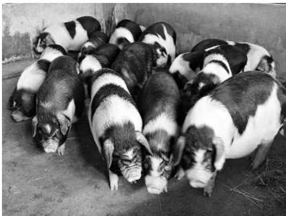
▲湖南供應到港澳的寧鄉土花豬

港大傳染及感染中心檢驗一百七十四個抗藥性大腸桿菌樣本，包括食用動物的糞便、健康大學生及兒童，