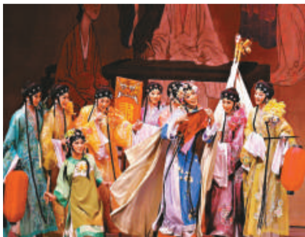
粵劇作爲粵方言區中最具影響力和海外最具代表性的中國戲曲劇種，成爲族群認同和文化交流的重要媒介

本次獲得通過的22項非物質文化遺產，其中有七項是來自少數民族地區。由於中國是多民族的國家，中華文化是多元一體。中國對少數民族文化進行了充分關注和支持。這次申報也是考慮到這一因素。例如：中國三大史詩中，其中兩大（瑪納斯和格薩爾）就列入本次人類非物質文化遺產名錄。