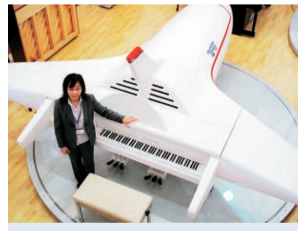
「飛機鋼琴」讓中外樂迷大開眼界