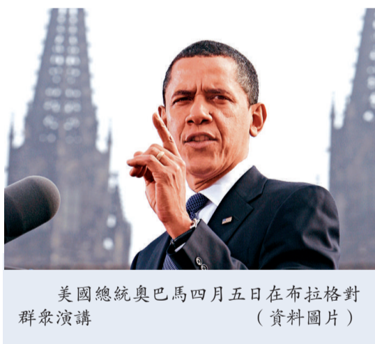
美國總統奧巴馬四月五日在布拉格對群眾演講 (資料圖片)