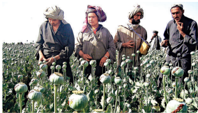
阿富汗農民在坎大哈的罌粟田中工作 (資料圖片)

霍爾布魯克則認為，塔利班的財富大部分來自波斯灣的私人資助者。駐阿美軍最高指揮官麥克里斯特爾認為，塔利班多渠道的資金來源給美軍的打擊活動帶來了困難。