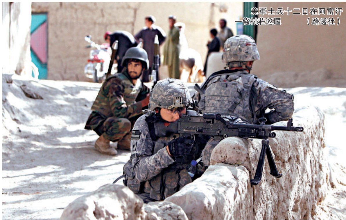
美軍士兵十二日在阿富汗一條村莊巡邏

由於阿富汗局勢日益惡化，駐阿美軍最高指揮官麥克里斯特爾和其他高級將領公開要求美國再向阿增派四萬兵力。九月下旬，麥克里斯特爾向美國白宮和五角大樓提交了一份秘密報告，請求政府向阿富汗增派援兵和其他資源。他在報告中說，阿富汗的局勢正在持續惡化，沒有更多的支援，美國將在這場戰爭中徹底失敗。麥克里斯特爾還警告說，除非美國及其盟友贏得主動，並在明年內扭轉軍事失利局面，否則美國將面臨戰略失敗。