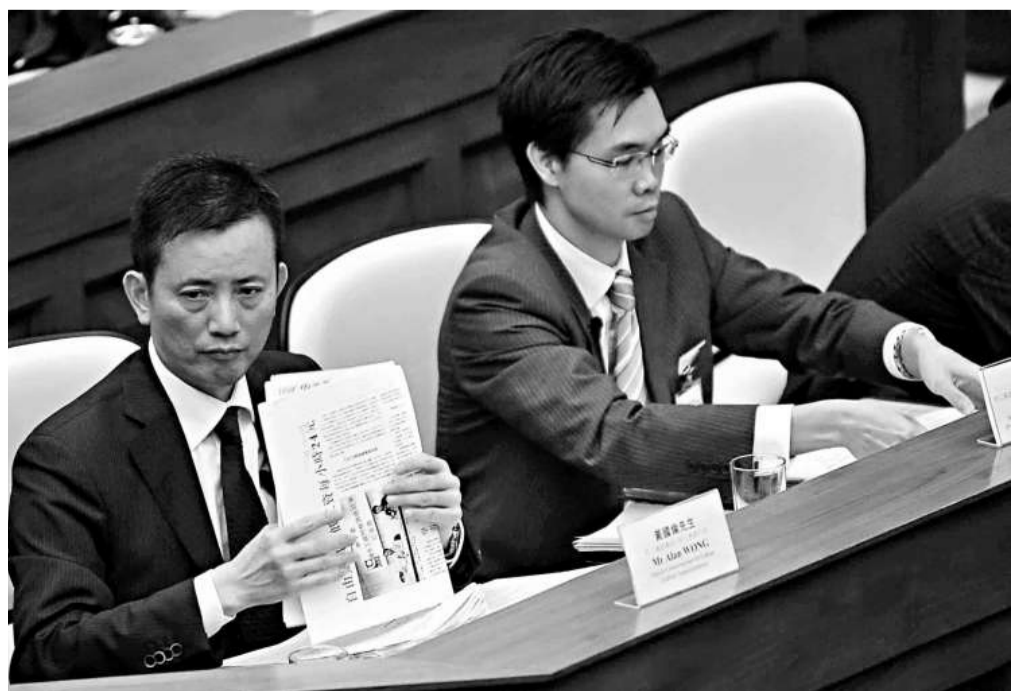
勞工處處長黃國倫（左）表示，訂立最低工資水平是一項複雜及富爭議性的議題，必須先諮詢各界，及考慮各經濟數據等因素才可制定（中通社）

議員謝偉俊質疑，最低工資是否違反基本法第五條，保持原有資本主義制度和生活方式、五十年不變的條文。法律草擬專員文偉彥在會議上強調，在基本法通過前，本港已有法例容許當局訂定某行業的最低工資，特首亦有權就個別行業設立委員會，就訂定最低工資向特首提供意見。