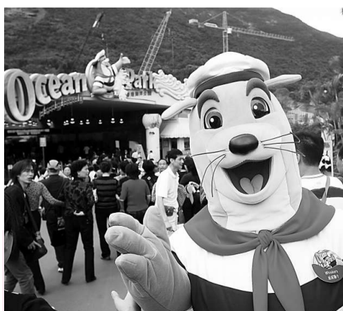
海洋公園旺場，在國慶黃金周入場人數較去年同期增加一成（資料照片）

《海洋公園公司條例》於一九八七年制定，用以規管海洋公園的運作，並將其定義為「位於南朗山並以海洋公園命名的公眾康樂及教育公園」，令海洋公園必須以推廣康樂及教育的方式賺取盈利，難以將業務擴展至海外。