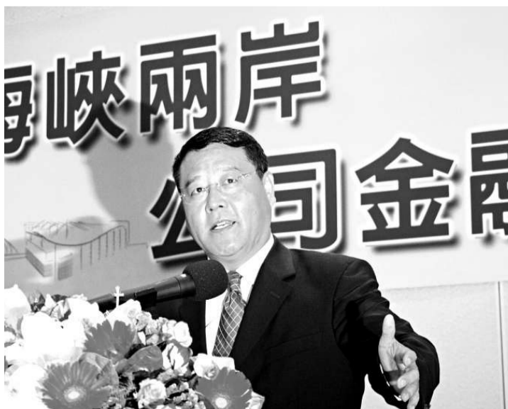
張偉昨日率團在台北參加「海峽兩岸公司金融治理研討會」時表示，將增加對台採購及來台投資

【本報訊】據中新社台北十四日報導，大陸的中國國際貿易促進委員會副會長張偉十四日率團在此間與台灣外貿協會及台灣金融界專家就海峽兩岸公司金融治理舉行研討會。張偉指出，《海峽兩岸金融合作協議》的簽署為兩岸制度化合作注入了新的內容，有助於改變目前兩岸經貿過程中「大經貿、小金融」的格局。 過去一年，大陸成為台灣最大的出口市場和台商境外投資最多的地區；而台灣也成為大陸的第七大貿易夥伴。今年五月間，大陸宣布推動企業赴台投資的八項方案，台灣亦公布陸資直接赴台投資的具體政策，正式開啓了兩岸雙向投資的時代。 在此背景下，過去滯後的金融合作，已無法適應當前兩岸經貿關係發展需要。尤其是國際金融危機，嚴重影響到台資企業在大陸的投資經營活動。觀察人士發現，加強兩岸金融合作，特別是加強公司治理層面的交流，對拓寬發展並從根本上推動兩岸經濟深入交流大有益處。 此間工商業界積極評價今年四月出台的《海峽兩岸金融合作協議》，認為其率先揭開了兩岸制度化合作的序幕。他們表示，如何在開拓市場時更快地熟悉