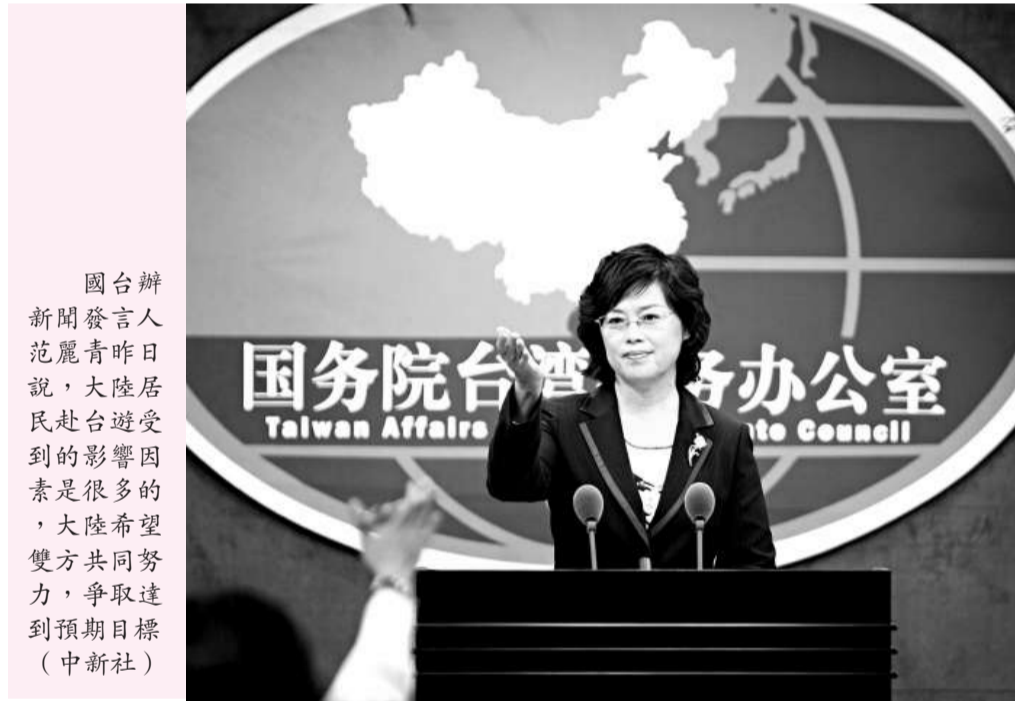
國台辦新聞發言人范麗青昨日在台北對媒體說，大陸居民赴台遊受到的影響因素是很多的，大陸希望雙方共同努力，爭取達到預期目標

【本報記者王德軍北京十四日電】國台辦新聞發言人范麗青在今天舉行的例行記者會上，談及兩岸經濟合作框架協議（ECFA）是否列入第四次「陳江會」的協商範圍時表示，兩岸相關學術研究機構就此展開的研究工作已經基本完成，並且分別公布了研究報告。兩岸各自研究的結果表明，商簽兩岸經濟合作協議符合兩岸同胞的利益，對於兩岸經濟發展均具有積極的促進作用。兩岸的專家還將共同進行深入探討。