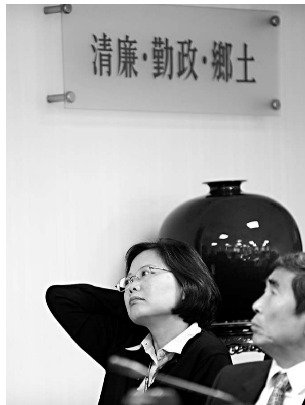
援扁會議流產 民進黨中常會十四日原排定討論聲援陳水扁司法人權案，因中常委出席不踴躍，主席蔡英文裁示下星期再討論。（中央社）