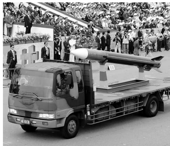
天弓三型導彈二〇〇七年「雙十節」亮相（資料圖片）

程導彈射程約為三千到五公里，以三千公里計算，射程遠及甘肅。換言之，包括華北、華中、華南的重要城市，都在射程範圍內。