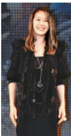
▲高賢貞的美沒有侵略性，男女皆受落

高賢貞則成為最養眼女星，得票率為15%，而且她被讚為櫥窗美女，意即她的樣子像百貨店櫥窗的人型公仔。另外，上榜的女明星包括金泰希、李英愛、李幼媛及金慧秀。