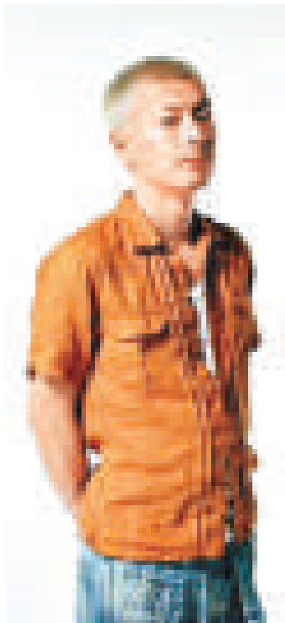
▲SU與大塚愛惺惺相惜 ▼張東健五官俊秀