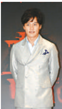
▲李瑞鎮關注民生問題 李瑞鎮望居者有其屋