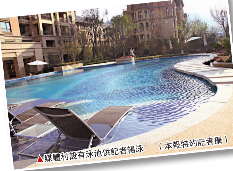
▲媒體村設有泳池供記者暢泳

在記者居住的媒體村北區7號樓2單元202房間內，配備了基本的住宿設施：2台電視機，2部座機電話，有線、無線寬頻上網和廚房、衛生間等基本設施。此外，房間裡還特別放置了2盆綠色植物。