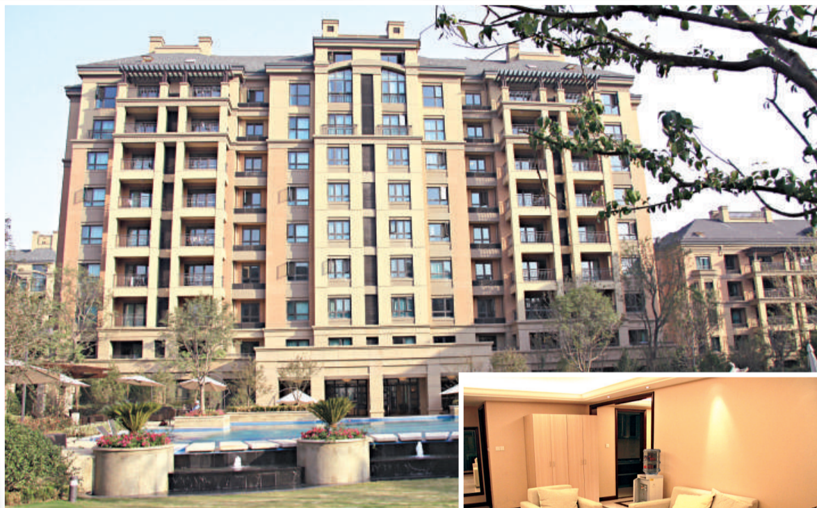
▲媒體村的環境清幽寫意 ▶記者房間內有完善的住宿設施