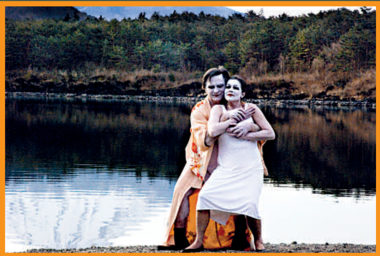
▲《快樂的傷逝》中的妻子酷愛「日本舞踏」，卻因家庭放棄成為舞者的夢想 ▲《疾走羅拉》令人印象深刻 ▲《快樂的傷逝》講述一對鸞鶴情深的夫妻的故事