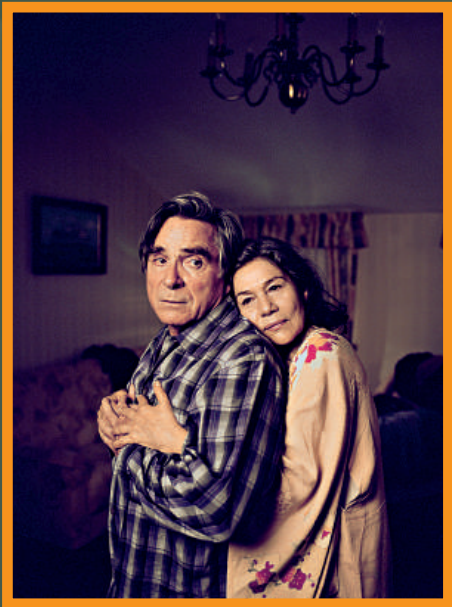
▲《快樂的傷逝》講述年邁丈夫經歷妻子死亡的傷痛，決定在有生之年為妻子圓夢 ▲《快樂的傷逝》部分外景於日本拍攝