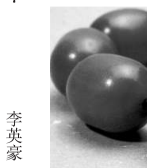
金沙種老蜜蠟珠串

「骨董」蜜蠟珠中，有一些珍罕品乃可遇而不可求。例如附圖的金沙種老蜜蠟舊珠子，全屬天然形成，歷時漫遠，並非人工造假所能達致。其最大特色為全珠表面均勻地布滿細小的發光點，使其看起來如沾滿粒粒閃閃生輝的金沙。只有老蜜蠟才能如此，可說是經歷悠長歲月的見證。 為什麼這罕有品種老蜜蠟會產生天然的「金沙」呢？原來所謂「金沙」，實則是老蜜蠟本身含特殊的礦物成分(因埋地甚久，易受四周泥層的礦物質沁蝕)，樹脂化石經數千萬年變化，受高熱、高壓等天然因素影響，逐漸硬化的同時亦質變，四周產生風化層，乃長期氧化所導致，結果形成很多細微閃爍的發光點。正如有些品種的老蜜蠟呈藍色(與人工染藍色迥然不同)，因地層含石灰多，碳酸成分便多，故變為藍色。像非洲一些地區所產的天然藍蜜蠟，除了有金絲漩渦紋以外，其風化層也偶會布滿磨沙點；其自然地慢慢氧化的原理與金沙種老蜜蠟大同小異，只是金沙種保持其原有的黃蠟色，而非藍色；由於風化層夠厚，故色調近肖熟透的「黃皮」果子。打磨成這麼大顆珠子者，委實鳳毛麟角。