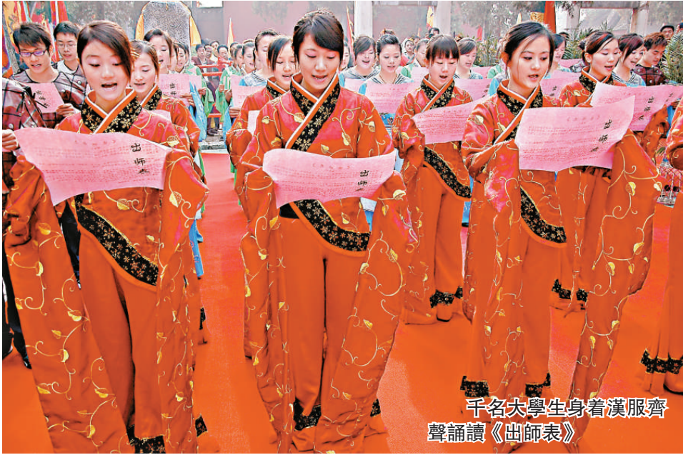
千名大學生身着漢服齊聲誦讀《出師表》

半島酒店重返上海是集團發展的重要里程碑，對香港上海大酒店有限公司主席米高·嘉道理爵士來說也別具意義，因為其祖父輩於 1911 年至 1948 年期間曾定居上海及發展酒店業務。米高·嘉道理爵士曾表示：「上海半島酒店象徵了本集團回歸其誕生之地。我們會秉承一直賴以成功的元素，包括優越位置、豪華舒適住宿、先進完善設施、頂尖餐飲質素及一流待客之道等優秀傳統，令半島酒店成為上海矚目的新地標。」