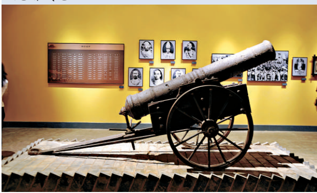
▼《百年軍校將帥搖籃》主題展覽上展出的光緒鐵炮