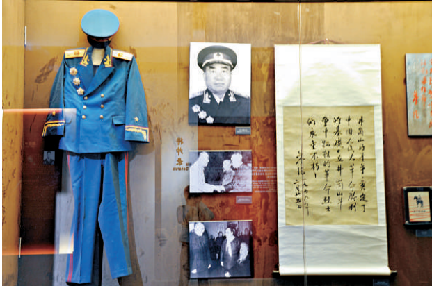
▲《百年軍校將帥搖籃》主題展覽上展出的朱德元帥服