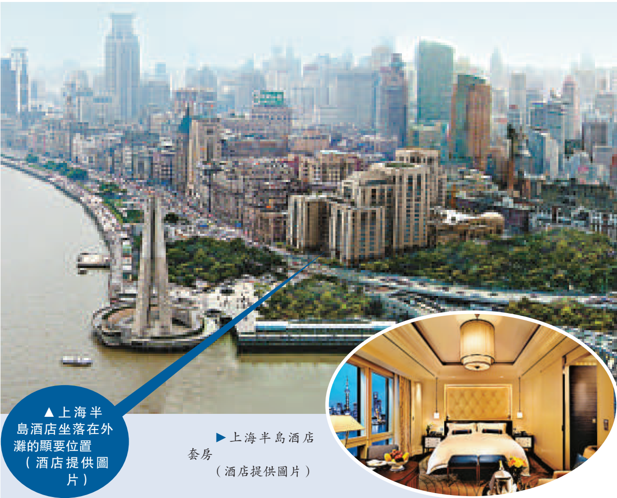
▲上海半島酒店坐落在外灘的顯要位置

當然，這樣的奢華享受代價也不菲，上述套間加露台一晚上的租金為人民幣六萬五千元。酒店負責人介紹，上海半島酒店將於明年三月正式開幕，屆時酒店的房價將在三千二百元至一萬三千五百元之間。