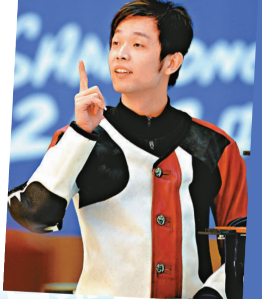
▲浙江選手朱啓南在獲勝後流露出自信的神情

以資格賽第一名晉級的朱啓南，在決賽中的發揮可謂比較穩定，除了第二槍打出9.6環的成績，其餘均在10環以上。江蘇小將高霆捷表現出色，一度將差距縮小到0.5環。關鍵的第九槍，朱啓南在停頓很久最後發槍，打出10.7環的成績將和第二名差距拉大到1.5環，幾乎已經鎖定了冠軍席位。最終，他以702.2的成績獲得冠軍。這是全運會射擊比賽產生的第一枚金牌，而在完成了全運會的奪金後，朱啓南也實現了自身的「大滿貫」。此前他在上屆的全運會中獲得第九名。 賽後朱啓南表示，「這麼多年來，包括我出道開始，省裡的比賽，世界盃，奧運會，我都拿了，但還沒有拿過全運會的金牌，今天拿到這枚金牌，算是這十多年來努力的一個結果吧，也給我畫上了一個圓滿的句號。」