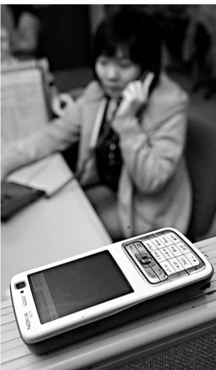
調查受訪青年平均不到一年八個月就換一部手機，更有近一成人在一個月內換手機

地球之友促請政府加快立法步伐，二〇一〇年立法推出管制電子垃圾的生產者責任法；同時，提醒消費者要對抗種種換機誘惑，真正依照自身需求，不要任由生產商及廣告商操控，變成電子產品的扯線公仔。