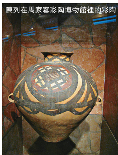
陳列在馬家窯彩陶博物館裡的彩陶

首屆全國馬家窯文化研究會前不久在其命名地甘肅臨洮召開，來自全國各地的考古專家和彩陶收藏愛好者齊聚一堂，對馬家窯文化的主要表現形式——彩陶的研究成果進行了交流。