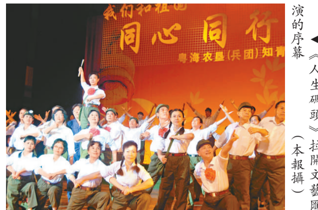
《人生碼頭》拉開文藝匯演的序幕

是次「DETOUR 2009」將由十一月二十六日至十二月九日舉行，詳情可瀏覽：www.detour.hk。