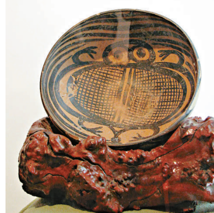
位於臨洮縣的馬家窯遺址 繪有蛙紋的馬家窯彩陶

甘肅馬家窯文化研究會第一個為中國彩陶鑒定提出了十種鑒定方法。彩陶博物館藏品豐富，有十餘件藏品為國內外的頂級珍品。展館共分三個展廳，從馬家窯類型先民水崇拜的文化開始，蛙是當時的圖騰；第二展廳展示半山類型土地崇拜，先民進入到農耕文明階段，最後以蛙上升為龍文化的精神圖騰結束，形成了一個研究馬家窯文化彩陶的完整鏈條。