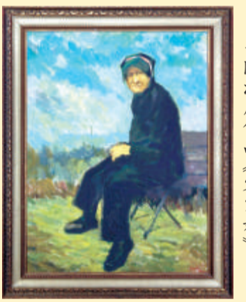
陳海鷹作品《客家婦》