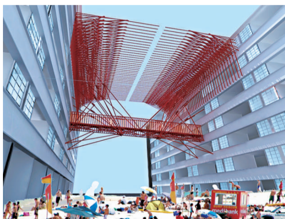
中環前荷李活道已婚警察宿舍將化身一個沙灘，兩座大樓中間將有竹棚裝置藝術

由香港設計大使主辦的「DETOUR」已踏入第四屆，透過舉辦多項別具特色的活動，讓市民參與藝術、設計、文化、城市及建築有關的活動，並提供一個平台，讓新一代設計新秀展現創意。DETOUR 為設計營商周的前奏活動並與之同期舉行，由商務及經濟發展局贊助。