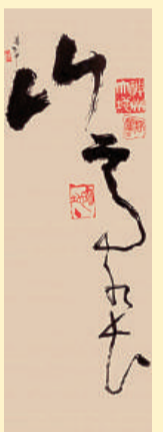
姜丕中作品《山高水長》