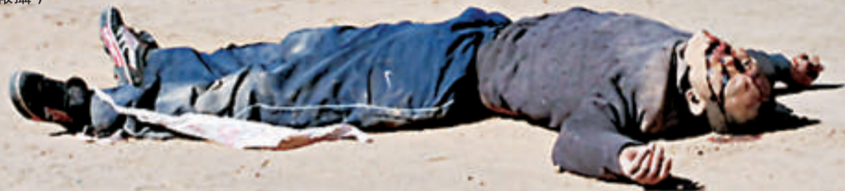
武警看守被擊斃逃犯 高博屍體