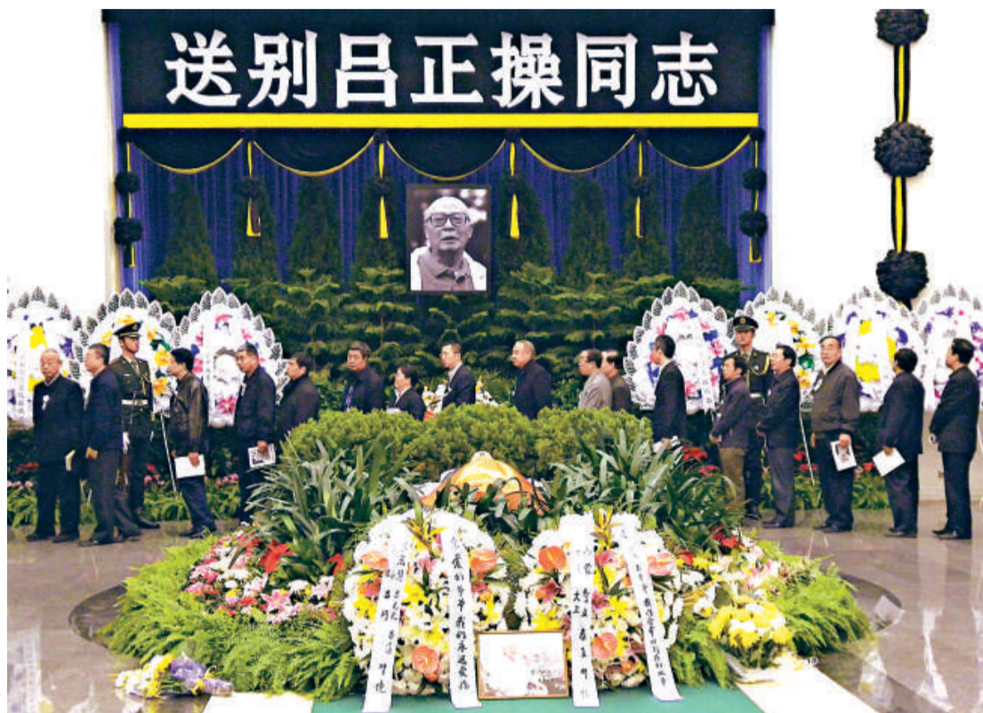
▲新中國最後一位開國上將呂正操的告別儀式，20日上午在北京八寶山革命公墓舉行，數千人前往送行