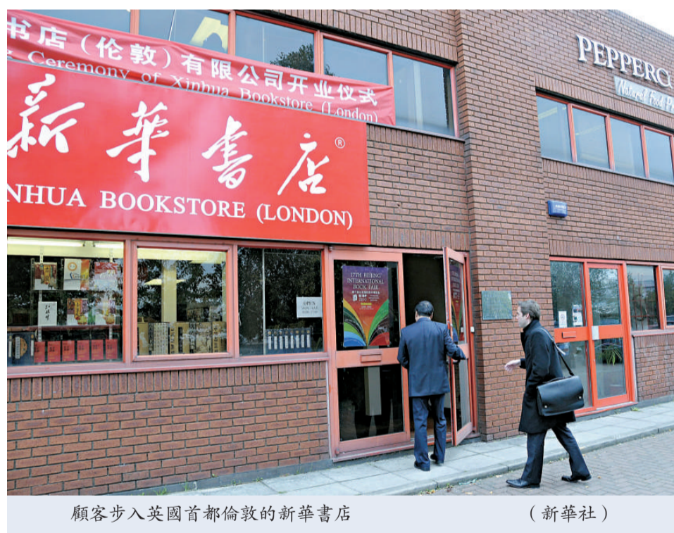
顧客步入英國首都倫敦的新華書店

【本報訊】據新華社倫敦二十日電：歐洲首家新華書店二十日在英國倫敦正式開業，打開了一扇讓英國讀者了解中國的窗口。