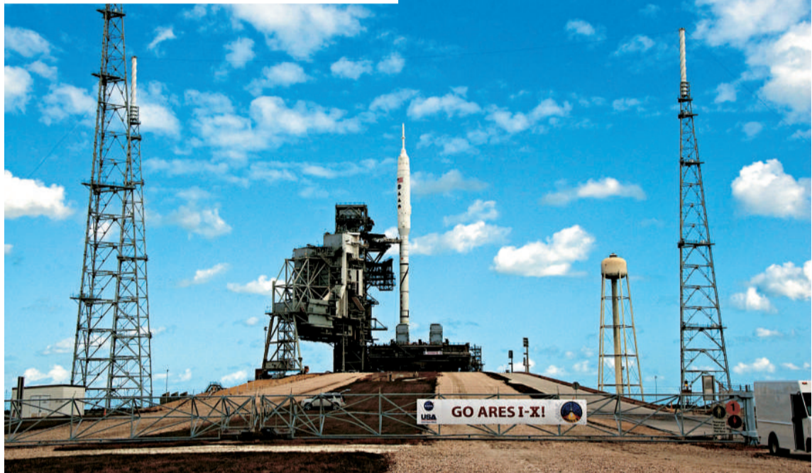
◀▼美國太空總署新火箭「戰神一號」停放在39B發射台上準備發射

「戰神一號」的高度超過了美國自由女神像，工程師用了整整一夜時間才將其從飛機棚拖到發射台。從飛機棚到發射台雖只有六點四公里，但工程師們卻用了七個多小時。該火箭將於下周二升空，以測試第一節火箭的性能。該火箭耗資四億四千五百萬美元。