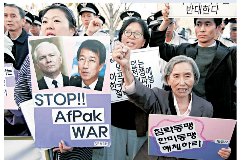
韓國首爾民眾抗議美國國防部長蓋茨到訪 (路透社)