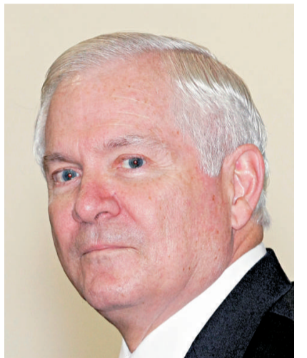
美國國防部長蓋茨

韓國國防部一直致力於推進「韓國型」導彈防禦體系的建設。據悉，「韓國型」導彈防禦系統與日本的高層導彈防禦系統不同，主要針對首都圈以及核心地區進行保護，注重低空防禦體系的建設。