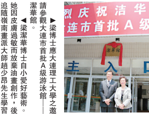
梁潔華與多位人士合影