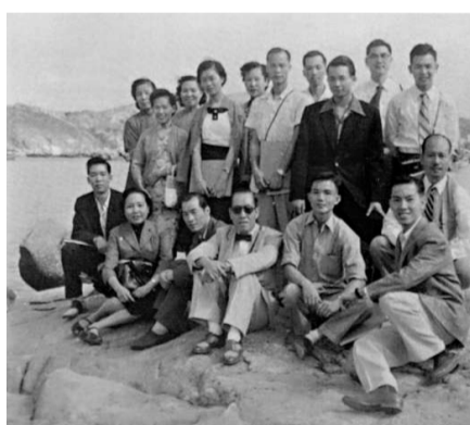
梁潔華與多位人士合影