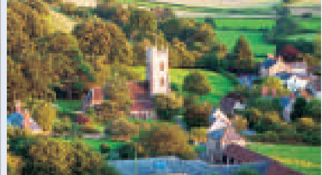
▲英國鄉間的聖公會教堂（資料圖片） ▲教皇本篤十六世歡迎聖公會教徒加入羅馬天主教（資料圖片）