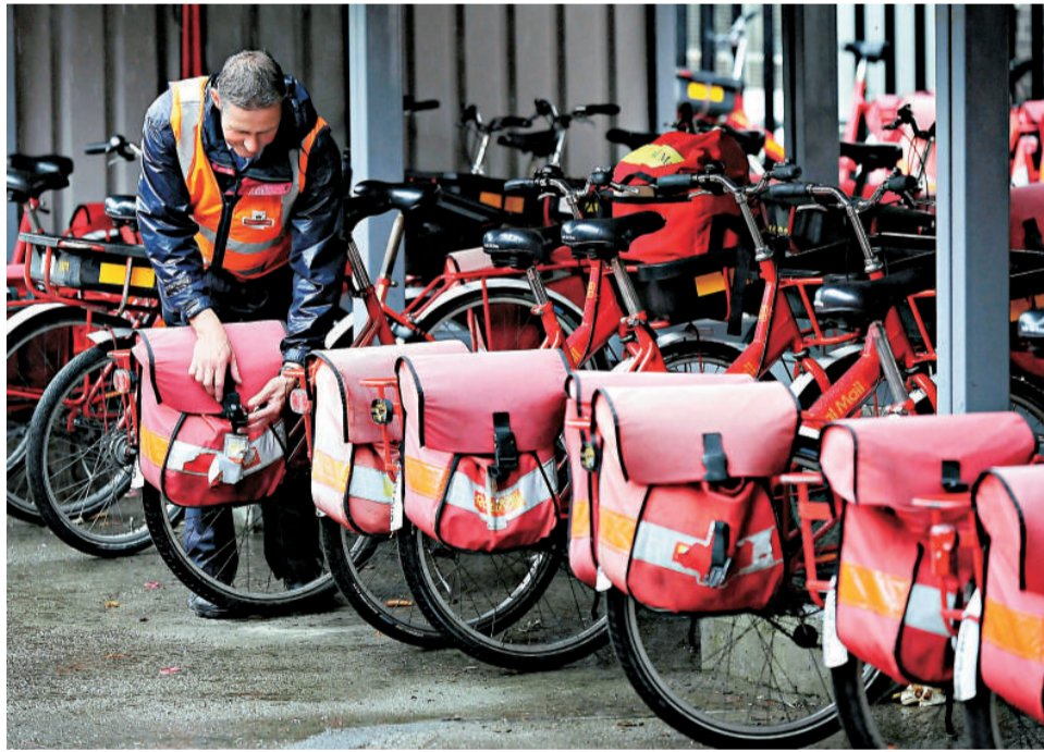
英國皇家郵政公司職員歸還公司單車，準備罷工

【本報訊】綜合外電二十二日報導：英國大約四萬二千名皇家郵政公司郵局職員和郵車司機二十二日早上上街，展開四十八小時的全國大罷工。他們指責資方和政府未能與他們達成協議，迫使他们採取工業行動。