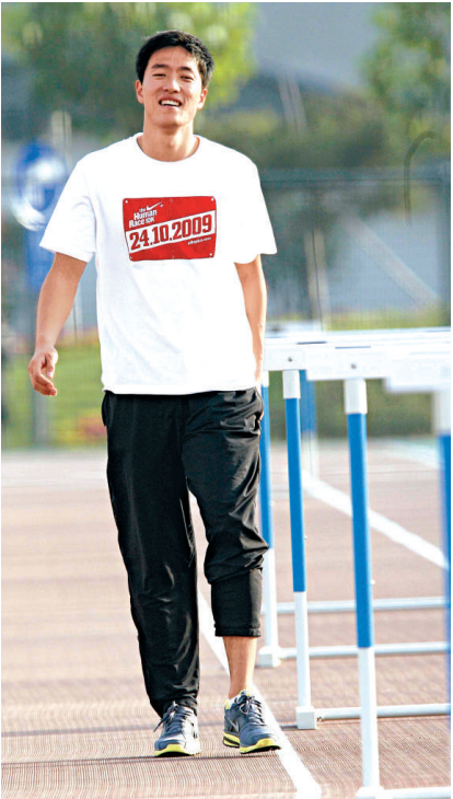
▲劉翔這次參賽，以安全完賽為主，不會勉強追求好時間

24日晚上7時55分，男子110米欄將進行預賽，決賽定於25日晚上7時50分進行。