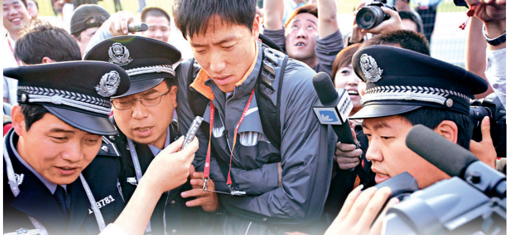
▲劉翔去到哪裡都大受歡迎

沒有感到任何壓力。劉翔的教練孫海平在此間表示，劉翔全運會的目標就是「安全」奪冠，決賽成績會在13秒20至30之間。