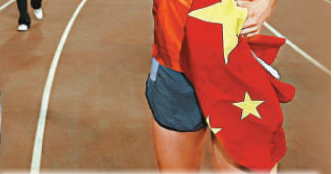
綜合金牌榜（截至23日）