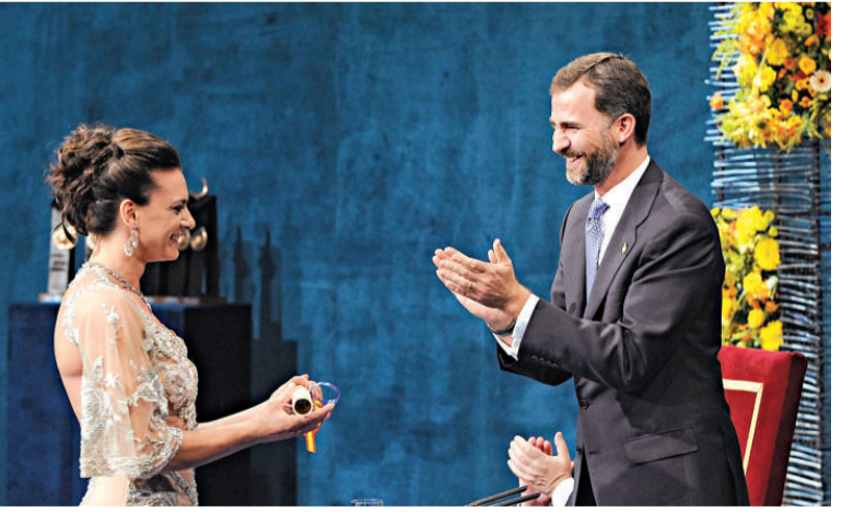
▲西班牙王儲費利佩（右）向伊辛巴耶娃頒發阿斯圖里亞斯王子體育獎

由於NBA與裁判工會此前在新一期勞資合同談判上破裂，所以NBA只好動用來自發展聯盟和WNBA的裁判執法季前賽。斯特恩希望正規裁判能夠在27日新賽季揭幕時取代目前還在執法季前賽的後備裁判。