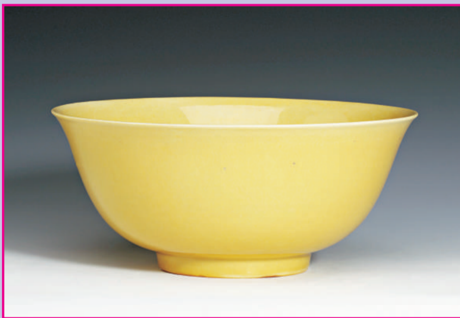
明嘉靖·黃釉撇口碗 高:8.5厘米 寬:19.5厘米 足徑:8厘米