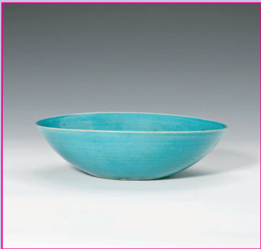
明嘉靖·孔雀藍釉臥足碗 高:4.3厘米 寬:13.2厘米 足徑:5.2厘米