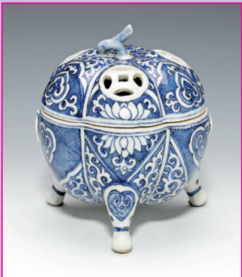
明嘉靖·青花如意蓮紋三足薰爐 高:12.5厘米 寬:11.5厘米