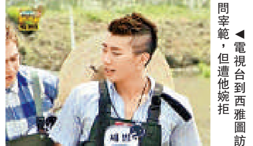
◀電視台到西雅圖訪問宰範，但遭他婉拒

男子偶像組合「2PM」隊長宰範因早前的反韓言論，而令他暫時回美國避風頭。韓國KBS電視台早前特別到西雅圖，打算訪問宰範現時的心情和近況，不過被他婉拒。不過他也相當合作，隨後特別發送一段影像，指自己現時仍在反思過失，不適合多談。另外，他當嘉賓的《無限挑戰》，早前播出時收視高企，足證他仍極受歡迎。