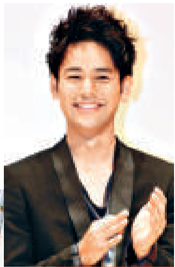
▼中川翔子首次在武道館演出，表現與歌迷同樣興奮 ▲演出劇集《天地人》的妻夫木聰成為同性最喜愛的男演員 ▲福山雅治成為同性最喜愛的男歌手