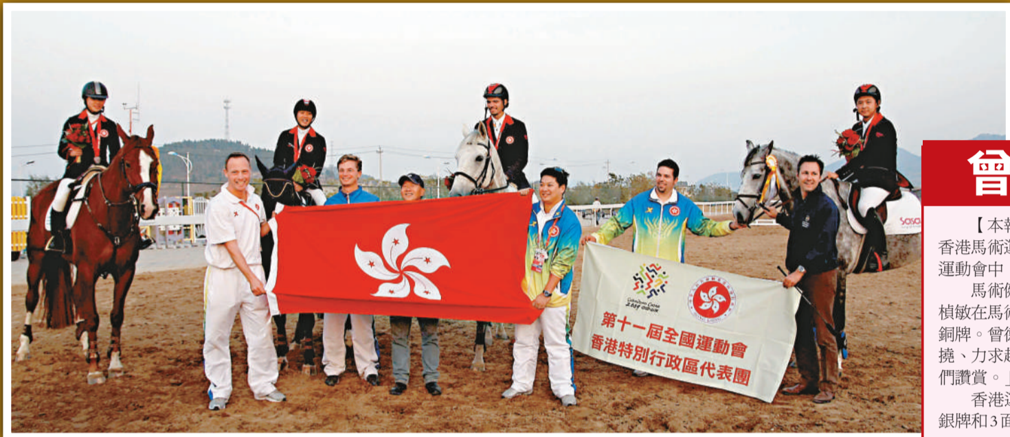
港馬術隊在賽後合照