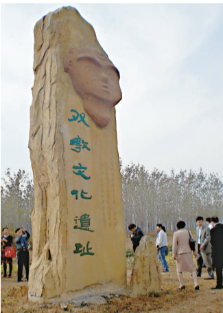
蚌埠雙墩遺址文物出土地點

【本報記者孫軍蚌埠二十五日電】「雙墩遺址出土文物及刻劃符號展」在安徽蚌埠展出，1000餘件有代表性的文物和600餘件帶有刻劃符號的陶器，出土於蚌埠雙墩遺址並首次公開亮相。安徽省文物局長陳建國表示，雙墩遺址位於安徽省蚌埠市淮上區雙墩村境內，中心面積約1.2萬平方米，前後三次艱難考古發掘，獲取1000餘件有代表性的文物和600餘件帶有刻劃符號的陶器。中國文字學會會長黃德寬指出，雙墩遺址文物經過初步整理和研究，已證實雙墩遺址是淮河流域中有一處較早的新石器時代遺址，距今年代約為7300年。