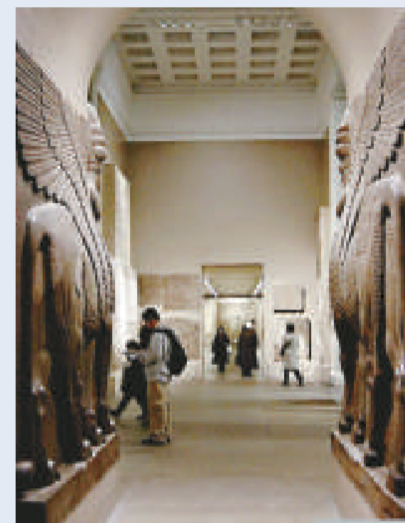
▲大英博物館收藏中國流失國寶數量龐大