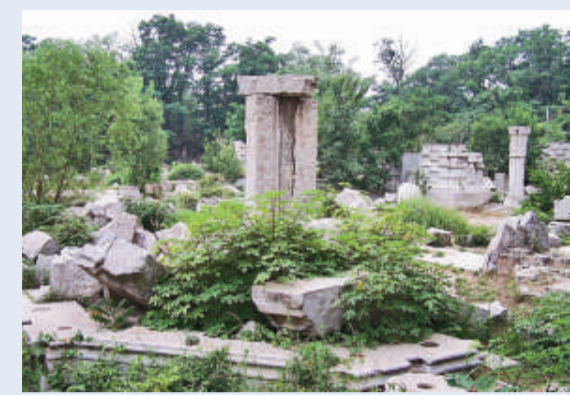
▲諧奇趣殘跡現狀