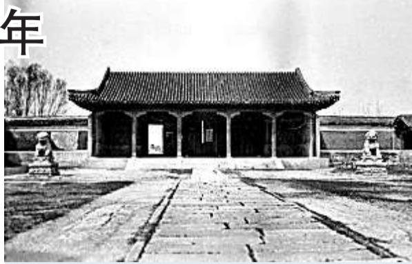
美國攝影師1918年拍攝的綺春園殘跡

(五) 觀水法殘跡。觀水法位於圓明園西洋樓遠瀛觀南端，是清乾隆帝觀看噴水景色之地。包括放置皇帝