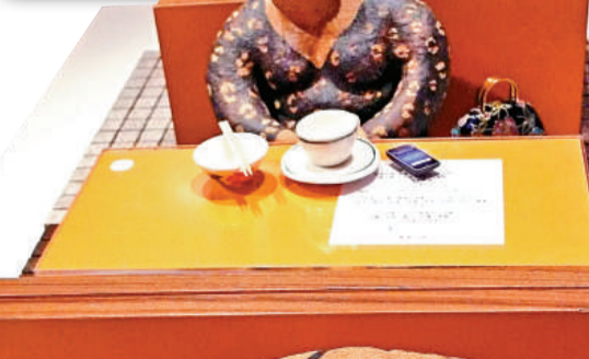
▲《繁忙時間四人一桌》反映香港地少人多的擠迫環境