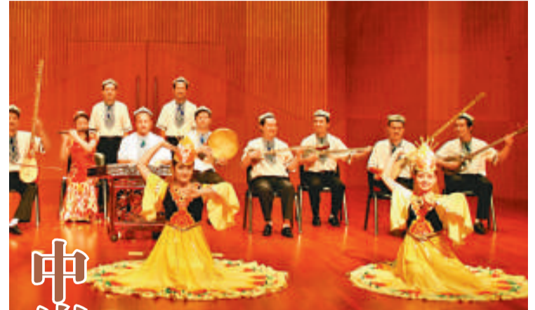
▲新疆師範大學民族樂團將來港表演