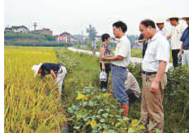
「湖湘三農論壇」專家認為，中國農民不具備承擔風險的能力

對於2項力爭在年底前開工的工程，滬鐵方面表示，備受矚目的滬通(南通)鐵路，9月底鐵道部、上海市和江蘇省已聯合向國家發改委上報了滬通鐵路可行性研究報告；上海「和諧型」大功率機車檢修基地，目前鐵道部已批覆了該項目建議書，上海鐵路局近日將正式向上海市規劃部門上報選址意見。