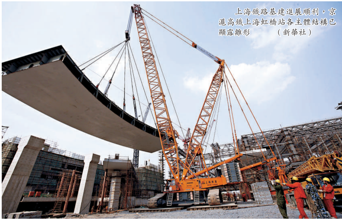
上海鐵路基建進展順利，京滬高鐵上海虹橋站各主體結構已顯露雛形

【本報記者楊楠上海二十七日電】記者今日從上海鐵路局獲悉，滬今年鐵路建設項目共有八項，基本都是重大工程。據鐵道局剛完成的評估，這八大項目總投資約達446.5億元(人民幣，下同)，建設進展目前均為順利。此外，滬鐵另有總投資約233.4億元的滬通鐵路、上海「和諧型」大功率機車檢修基地將力爭在年底前開工。至此滬上正在推進的鐵路工程項目總規模已達近680億元。