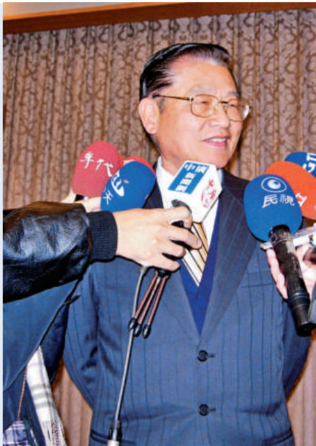
海基會董事長江丙坤今天率領新聞交流團登陸訪問（資料圖片）

林郁方表示，近日不論是循軍售途徑的「遠程預警雷達」，或循商售途徑的「空軍救護直升機」，都傳出美方在預算通過後，以種種理由要求大幅調增預算的情形，因此他提案凍結二分之一預算，以向美商傳達台灣不會任由美商予取予求的訊息。