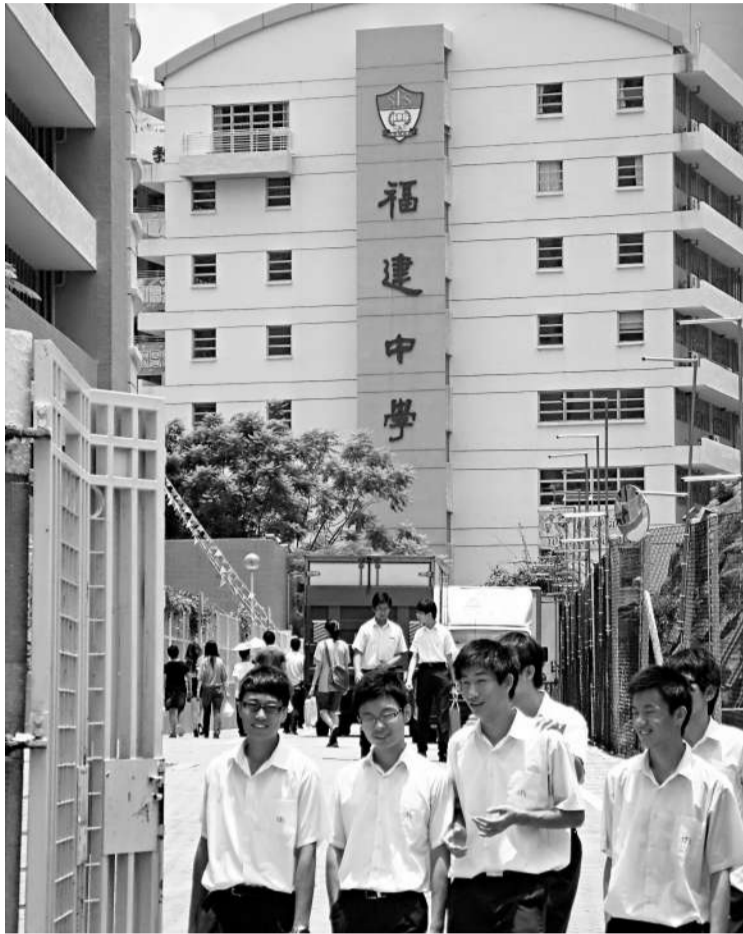
觀塘福建中學將耗資六百萬興建宿舍，準備招收內地生

就內地生來港讀高中，教育局發言人表示，教育局已開始與內地有關部門商討，將會繼續與業界討論具體安排，以擬定細節。除簽證問題外，教育局還需考慮學生來港後的生活安排，如兩地課程銜接、住宿安排等。推行時間表則需視乎與業界商討的進展，亦需要中央政策配合。